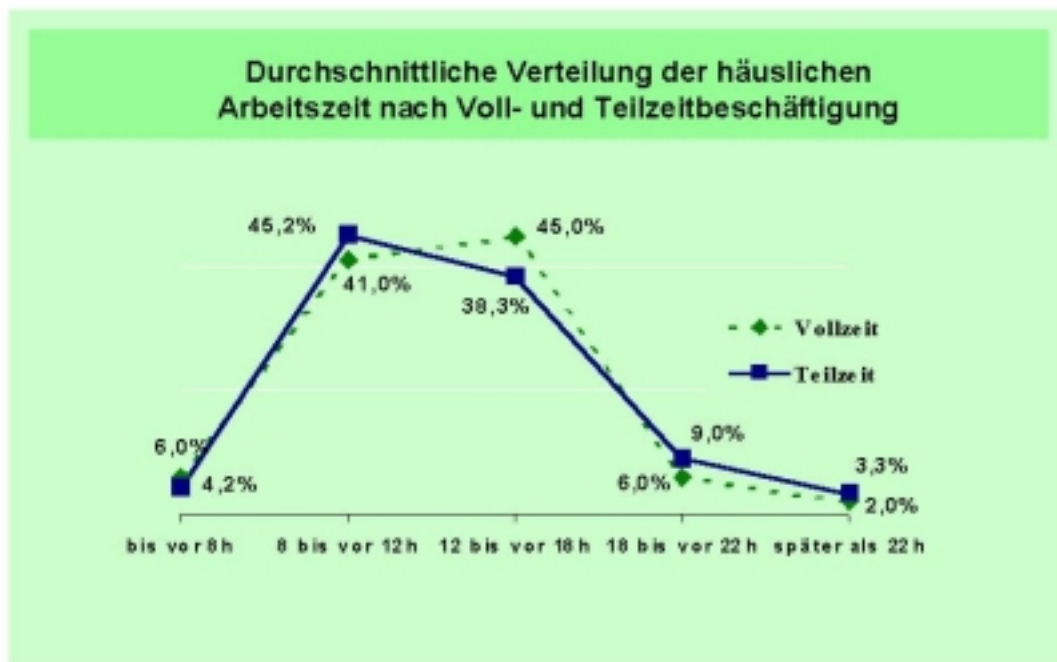
Übersicht 3 Verteilung der häuslichen Arbeitszeit nach Voll- und Teilzeitbeschäftigung

Der größte Teil der täglichen Arbeitszeit liegt dennoch zwischen 8 und 18 Uhr, aber es wird auch am frühen Morgen und am späten Abend gearbeitet. Dies ist nicht nur das Resultat des konsequenten Ausweichens auf Phasen, in denen die Störung bzw. Unterbrechung durch Dritte (insbesondere junge Familienmitglieder) weniger wahrscheinlich ist, sondern auch der permanenten Anwesenheit der Arbeit im privaten Umfeld zuzurechnen. Verlagerungen der Arbeitszeit auf die Randbereiche können somit Ergebnis freiwilliger oder notwendiger Flexibilität sein. Es kann aber auch Überlegungen auf Unternehmensseite auslösen, da die Option auf Zeitfenster des effektiven Arbeitens erkannt wird. Ein Arbeiten zu betriebsunüblichen Zeiten bedarf aber der Vereinbarung mit allen beteiligten Gruppen (z.B. Betriebsrat).