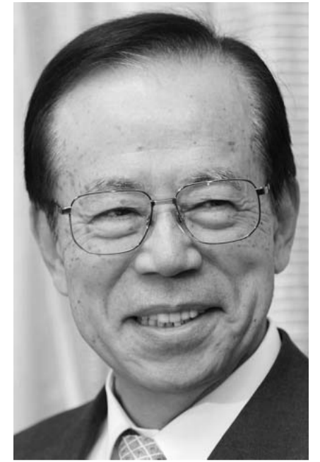
Yasuo FUKUDA

Deutschland will mehr Verantwortung tragen. So jedenfalls steht es in der Vereinbarung der beiden Koalitionäre.