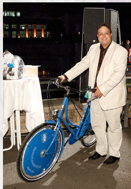
Glücklicher Gewinner des Goethe-Fahrrads.