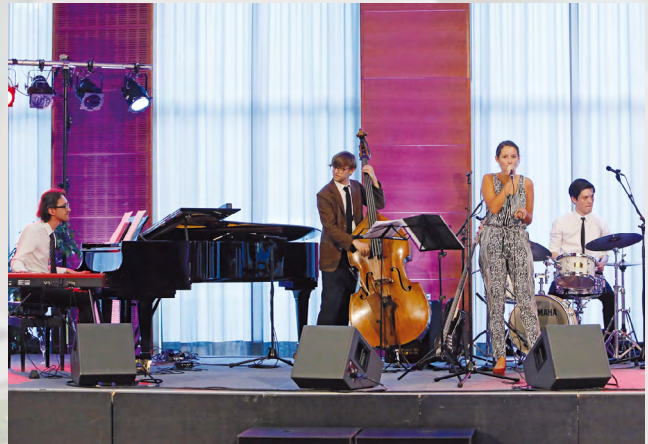
Das junge SRS Quartett begeisterte das Publikum.