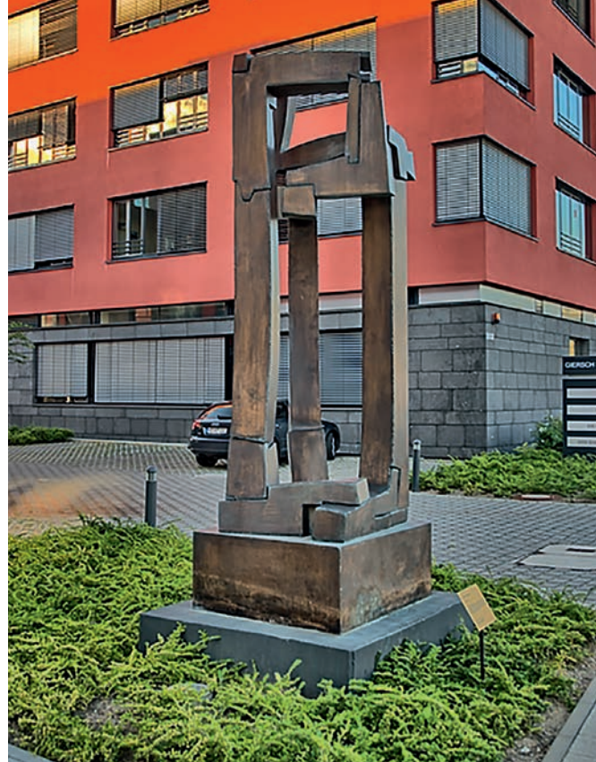
In guter Gesellschaft: Diese Skulptur mit dem Titel »Dreifaktor« des Potsdamer Künstlers Volker Bartsch wurde der Goethe-Universität im Jahr 2012 von der Stiftung Giersch geschenkt. Sie steht vor dem FIAS auf dem Campus Riedberg.