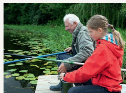
Etwas an die junge Generation weiterzugeben, das mag der Wunsch manches »Leihopas« sein.