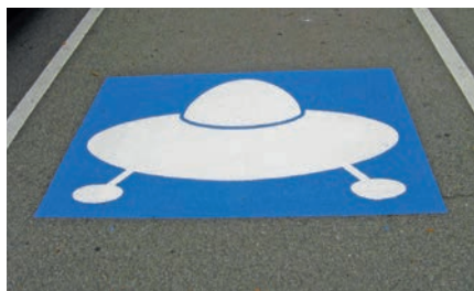
Außerirdisch: Jens Andres legt Parkplätze für Besucher an, die von weither kommen. Schon beim Frühlingsfest werden sie landen können.

bilder menschengemachte Geschichten erzählen. Aus Freude über den schönen Ausstellungsort hat die Bildhauerin direkt am Campus ein weiteres Kunstwerk geschaffen: Aus 80 Jahre alten Bordsteinen, die vom Gelände des Campus Westend stammen und die sie für diesen Zweck bearbeitete, errichtete sie die 57 Meter lange Stelenreihe »Steinfuge«, die auf den Wissenschaftsgarten zuführt.