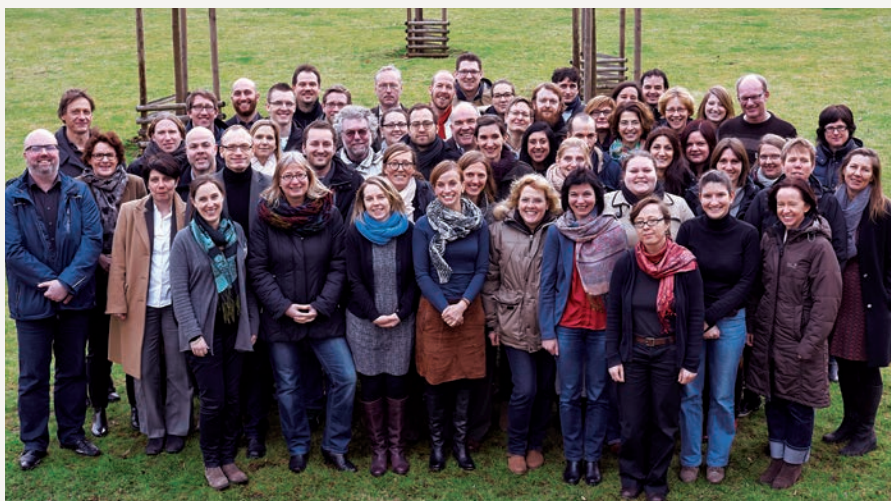
Darf seine erfolgreiche Arbeit fortsetzen: das Team von »Starker Start ins Studium«.