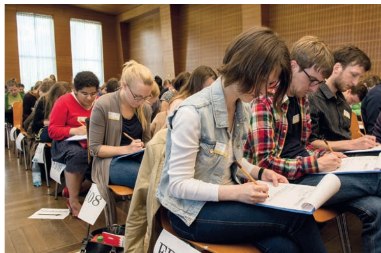
Beim Diktatwettbewerb am Campus Westend ringen die Teilnehmer 2015 Seite an Seite um die richtige Schreibweise.

Unter www.dergrossediktatwettbewerb.de können Sie schon jetzt für den entscheidenden Abend trainieren.